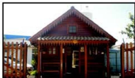
Fabricação própria vendida também a varejo

M: Com certeza já estamos pensando na expansão da marca Vanessa. A empresa está ampliando as suas instalações para promover o lançamento de queijos finos e a abrangência de novos mercados.